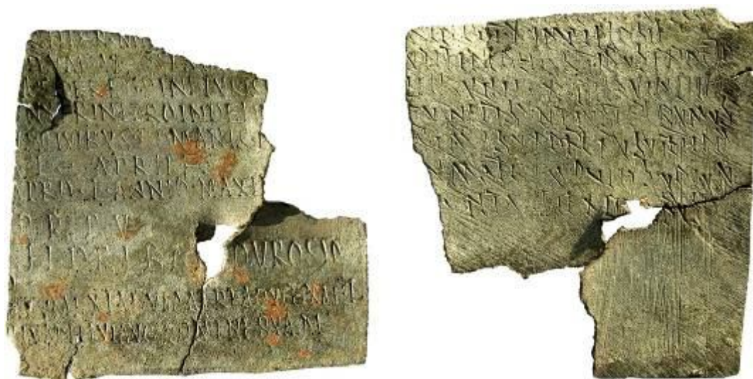
Зображення лицевого та зворотнього боків фрагменту лицевої таблички диплому.

Написи на боках таблички виконані технікою гравіювання та орієнтовані відносно один до одного під прямим кутом. Розміри літер 3 – 5 мм. Напис одного боку, визнаного лицевим, гравіюваний чітко окресленими літерами із засічками – апексами в стилі, близькому до так званого актуарного шрифту, який використовувався в стародавньому Римі для написання документів. Напис на зворотному боці важко зрозумілий, справляє враження недбалого скоропису - курсиву.