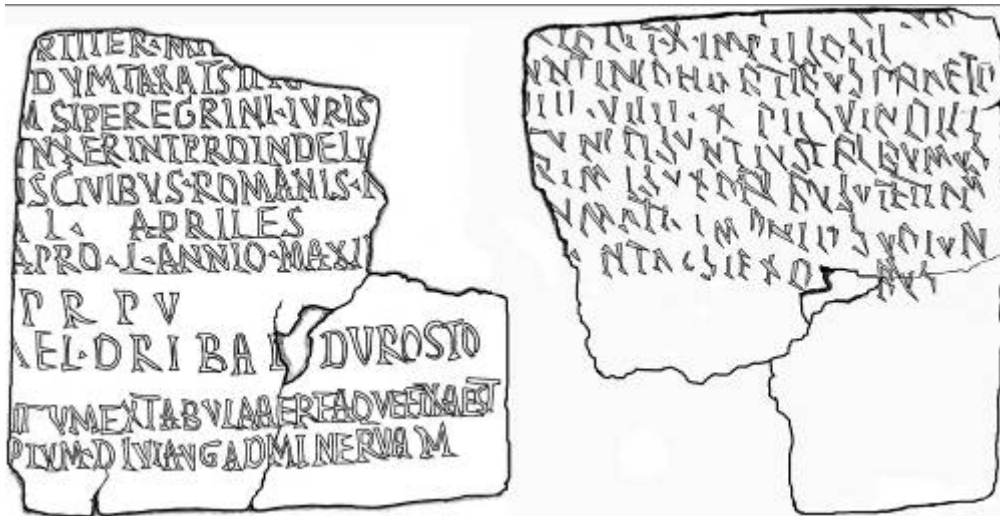
Написи на боках фрагменту лицевой таблички диплому.

Незважаючи на те, що римські військові дипломи надавалися протягом довгого часу, їхні тексти практично не зазнали змін. * Тексти дипломів були достатньо формалізовані та можуть служити зразками положень римського права. Кількість їхніх варіантів, що в основному було пов'язано з існуванням різних родів військ, невелика, всі вони мали однаково структуру. Після офіційного титулу правлячого імператора вказувалися рід війська та назви частин (легіони, флоти, преторіанська гвардія, різні допоміжні війська, і т. д.), військовослужбовці яких йшли в відставку; далі йшов розділ, де формулювалися права, які надавалися ветерану та обставини, за яких вони діяли. Після чого в документі вказувалась дата, називалася конкретна назва підрозділу, де служив відставник, в окремих випадках вказувалась також його військова спеціалізація та зазначалося ім'я командира. Далі обов'язково вказувалися імена ветерана та його батька і місцевість, з якої він походив. Завершувався текст юридичною формулою про те, що диплом є частковою копією більш загального документу (імператорського указу – constitutio ), про звільнення у військах ветеранів у відставку, який зберігається в Римі.