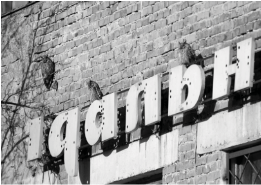
Рис. 2. Особини сов що полювали на кажанів розміщувались безпосередньо під сховищами.

Пелетки, що використані у роботі, зібрано у 2011-2013 рр. Вони характеризують позагніздовий, а саме зимовий аспект живлення птахів. Пелетки зібрані після виявлення вухатих сов на карнизи стіни центрального корпусу Кам'янець-Подільського національного університету імені Івана Огієнка (КПНУ), саме там, де у ніші підвіконня вже впродовж трьох років розміщувалась одна із зимових колоній рудих вечірниць. Зібрано 50 свіжих пелеток. На той період кількість вухатих сов, які днювали на ділянці сягала 30-40 особин. У полюванні на кажанів брали участь лише 3-4 особини (рис. 2).